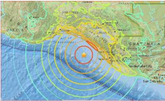
8,0 Beben vor Mexico am 08. Sept. 2017

Es gibt Überschwemmungen, Erdbeben, verheerende Katastrophen . Das geschieht nicht, um das Negative einer Sache zu beschönigen, sondern, weil die Menschheit dreigeteilt wird. Bitte fordere nicht die Zahlen, aber ein Drittel bleibt, ein Drittel geht und ein Drittel steigt. Es sollte aber nicht genau an der Größe eines Drittels festgemacht werden - also 33 Prozent -, sondern es sind generell drei Aspekte, die sich an den Erdenmenschen vollziehen werden. Dies ist eine Generalität. Im einzelnen wird aber ein gutes Drittel der Menschen bleiben. Diejenigen, die steigen werden - also den Aufstieg vollziehen -, werden weniger sein als diejenigen, die sinken. Diejenigen, die sinken, gehen in eine Dimensionalität ihres jetzt-Seins.