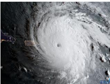
Hurrikan Irma Sept. 2017

Der Beginn dieses Prozesses war weit früher. Der Beginn war schon Anfang des letzten Jahrhunderts in deinem Land. Hier war eine starke Testphase für das Erdengeschehen. Spirituell gesehen war dies die Entdeckerzeit, gleich den Trappern, die ein Land entdecken - eine wichtige Zeit. Sieh das aber gelöst von euren politischen Anschauungen. Und diese Zeit wirkt mehr denn je, denn hier wurden die Fäden geknüpft, die bald zusammenkommen werden.