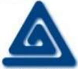
(U) BLogo aka "Boy Lover"