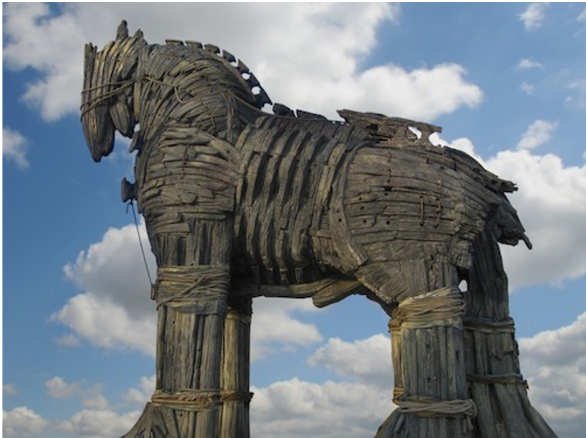
Das Geistvirus Wetiko als Trojanisches Pferd? Trick oder Geschenk?