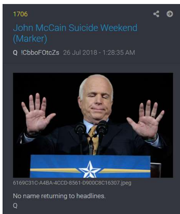
1706 QAnon Ankündigung eines Suicids von John McCain

Zum Beispiel wurde der Tod des Senators John McCain auf die Minute genau vorhergesagt. Auch das Datum stimmte. Kryptisch natürlich, aber es war im nachhinein sehr klar nachzuvollziehen.