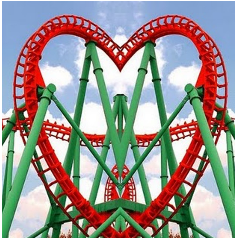
Willkommen im „HerzLand Unterhaltungspark“

Da das Universum zugunsten deines Erwachens konspiriert, bedeutet das sich Übergeben nicht, dass man aufgegeben oder die Schlacht verloren hat. Es ist in der Tat so, dass jedes Mal, wenn man sich einer höheren Macht ergeben hat, man dem Erwachen einen Schritt näher ist.