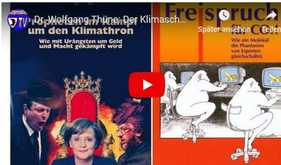
Dr. Wolfgang Thüne: Der Klimaschwindel – Freispruch für CO2/Propheten im Kampf um den Klimathron: https://www.youtube.com/watch?v=EIOoIVPowiU