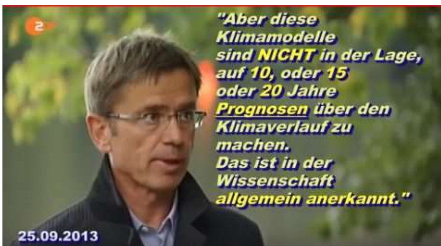
Fundstück #011: Stefan Rahmstorf über "Klimamodelle" !! [ZDF.DE, 2013]: https://www.youtube.com/watch?v=4hrx08tInBg