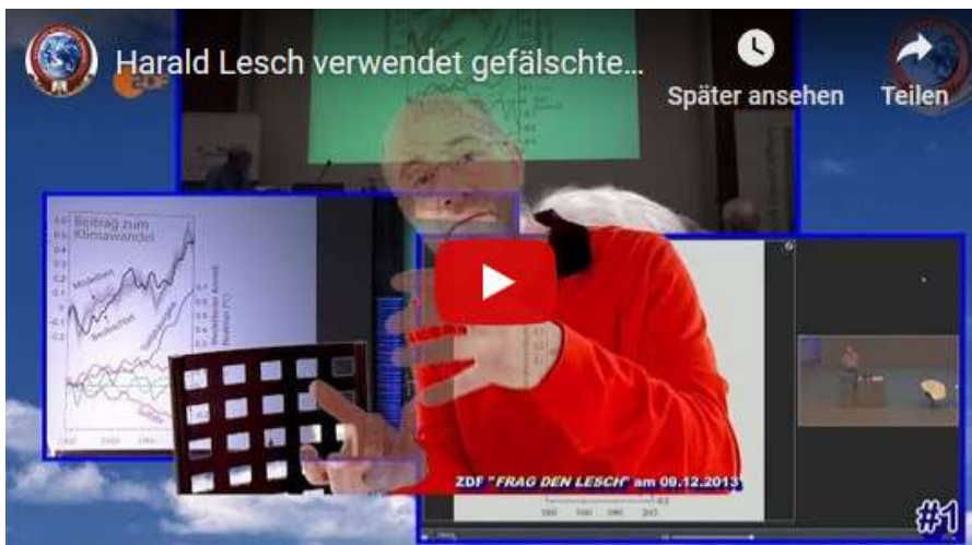
Harald Lesch verwendet gefälschte Grafik in seinen Vorträgen...und weitere Peinlichkeiten !!: https://www.youtube.com/watch?v=MyPzHeBUu6Y