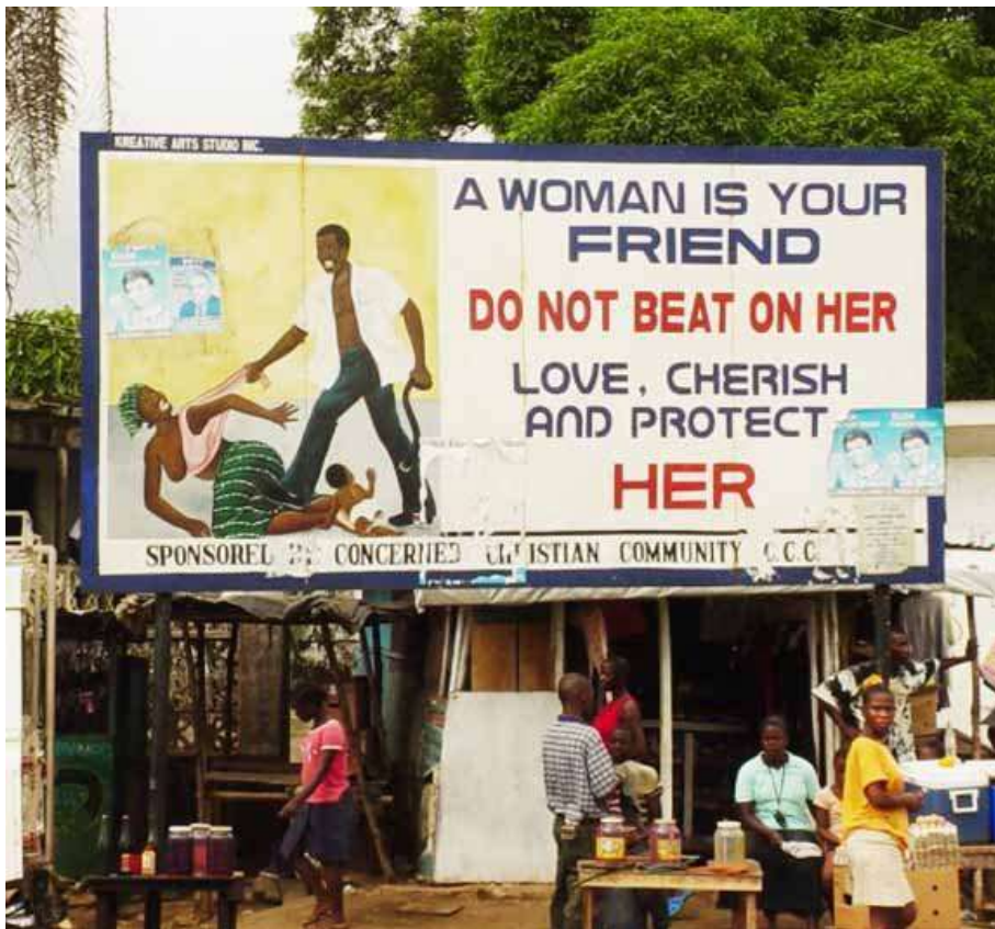
Öffentliches Plakat in Südafrika

Stewart hat sich offenbar nie gefragt, warum afrikanische Kulturen diese Normen nicht verinnerlichten, das heißt, warum sie niemals ein moralisches Bewusstsein entwickelten, aber es ist unwahrscheinlich, dass es sich dabei einfach nur um einen historischen Zufall handelt. Wahrscheinlicher ist, dass es die Folge eines mangelhaften abstrakten Denkvermögens ist.