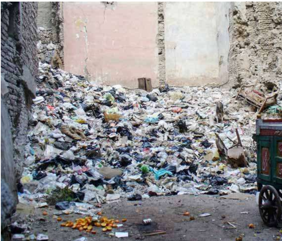
Müllberg im Sudan

Als ich mich bei McDonald's am Drive-In-Schalter einreihe .... [sehe ich,] dass im Auto vor mir vier Schwarze sitzen. Und wieder...fängt mein Kopf unbewusst an zu rechnen: Wir werden hier ewig sitzen, bis diese Leute sich entschieden haben, was sie bestellen möchten. Ich schüttelte buchstäblich den Kopf über mich selber.... Mein Gott, meine Kinder sind halb schwarz! Aber dann der Clou: Wir warteten und warteten und warteten. Jeder der vier...lehnte sich aus dem Fenster und bestellte separat. Die Bestellung wurde mehrmals geändert. Wir saßen und saßen und ich schüttelte wieder den Kopf, dieses Mal über das verflixte Rätsel, das Rasse in Amerika darstellt. Ich wusste, dass das vergrabene Gefühl, das mich diese Unorganisiertheit voraussehen ließ ...rassistisch ... war. Aber meine Voraussage war korrekt (S 234-235)