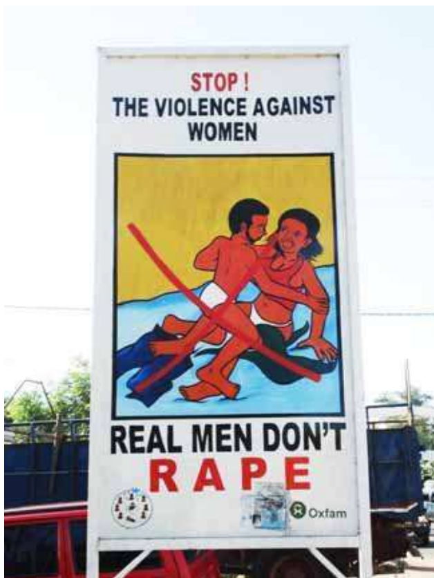
Öffentliches Plakat in Liberia

Diese Vorfälle und die Reaktionen, die sie hervorrufen – „das menschliche Gehirn schreckt zurück“ „jenseits meines Fassungsvermögens“ „dem gesunden Menschenverstand nicht zugänglich“ – stellen ein Verhaltens- und Denkmuster dar, dass nicht einfach fortgewünscht werden kann, und bieten zusätzliche Untermauerung für meine Behauptung, dass Afrikaner einen Mangel an moralischem Bewusstsein haben.