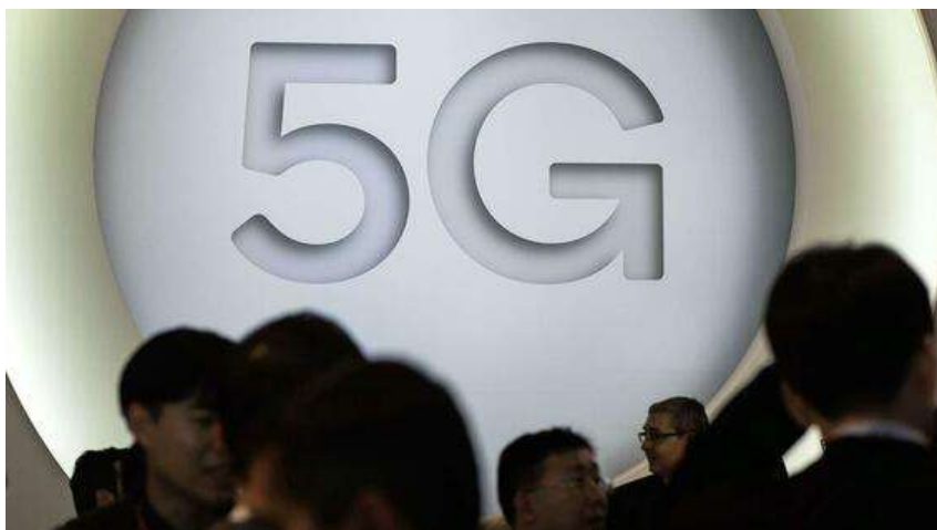
Tech-Hype. Die Akzeptanz in der Bevölkerung könnte sinken.

Das wäre in Europa erst recht sinnvoll. Die EU pumpt zurzeit mehr als 700 Millionen Euro in Projekte zur 5G-Entwicklung, aber nicht eines davon dient der Risikoforschung. Vielleicht ist es Zeit, dass Europas Parlamentarier die Prioritäten des Programms ändern.