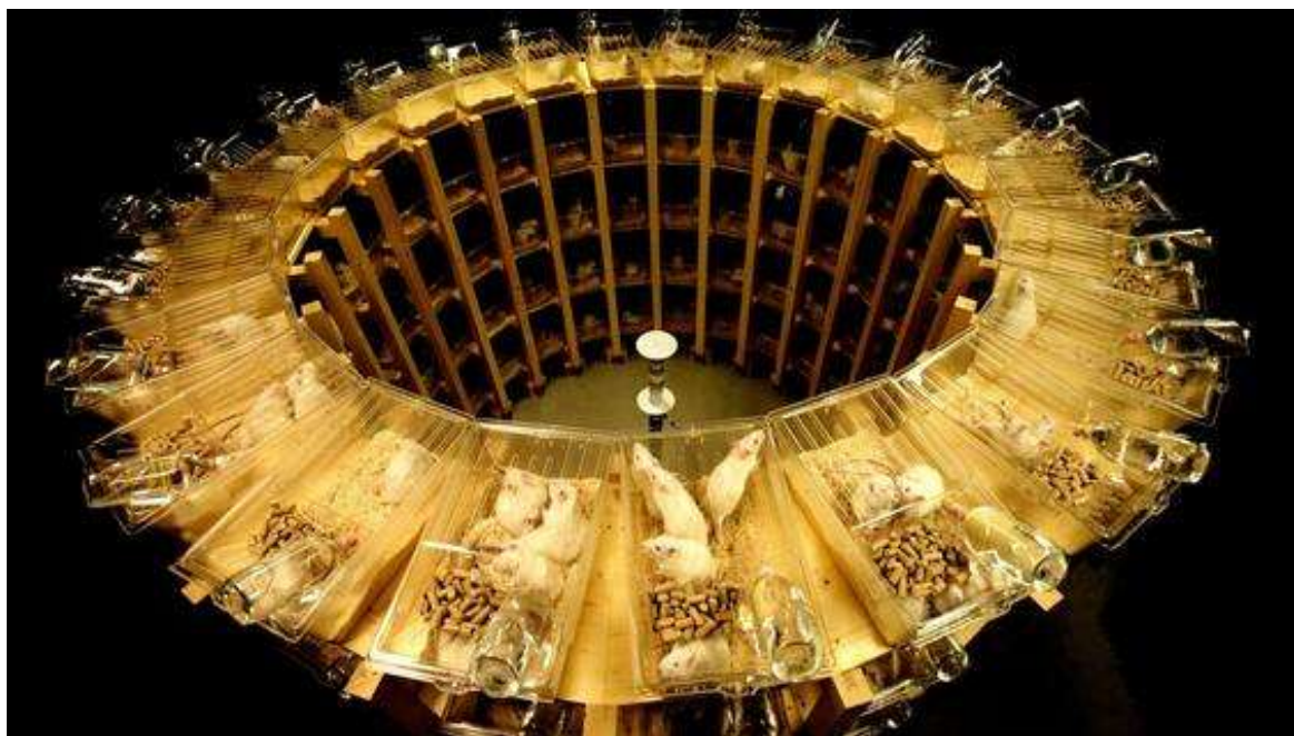
Versuchsratten im Labor des Ramazzini Instituts werden Strahlung ausgesetzt.

Die auf diese Art hergestellte Einheitsmeinung ist bequem für alle Beteiligten, die Telekom-Industrie und ihre Kunden genauso wie die verantwortlichen Politiker, die auf Wachstum und Jobs durch die mobile Datentechnologie setzen. Aber sie bricht mit einem zentralen Versprechen der EU-Verfassung: dem Vorsorgeprinzip.