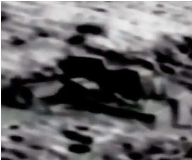
(In NASA-Archiven gefundene, seltsam komplexe Struktur auf dem Mond)

Es sieht aus wie eine Luftaufnahme von etwas wie einer Nordpol-Installation oder einem Außenposten, sagt Redfern. Klare Winkel, rechte Winkel, die so etwas wie eine intelligent gebaute Struktur zeigen. Die Frage ist: Was ist das? Wofür wird es verwendet?