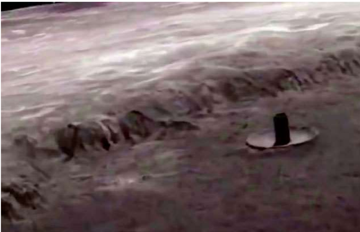
(Lunare Objekte im Mare Crisium)