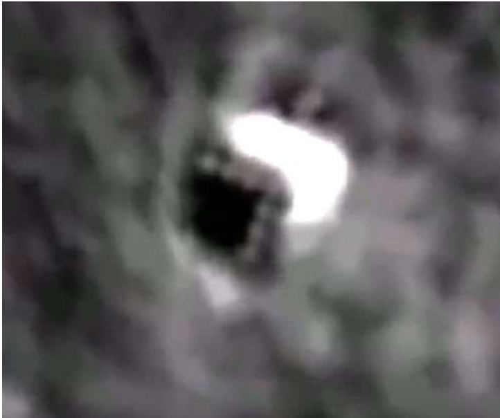
(Mit der Google Moon-App gefundenes Objekt)

Ist es eine Installation? Wir wissen wirklich nichts anderes als die Tatsache, dass es diese Winkel hat, diese hellen Lichter hat, und es scheint wirklich in irgendeiner Form von Menschen gemacht zu sein.