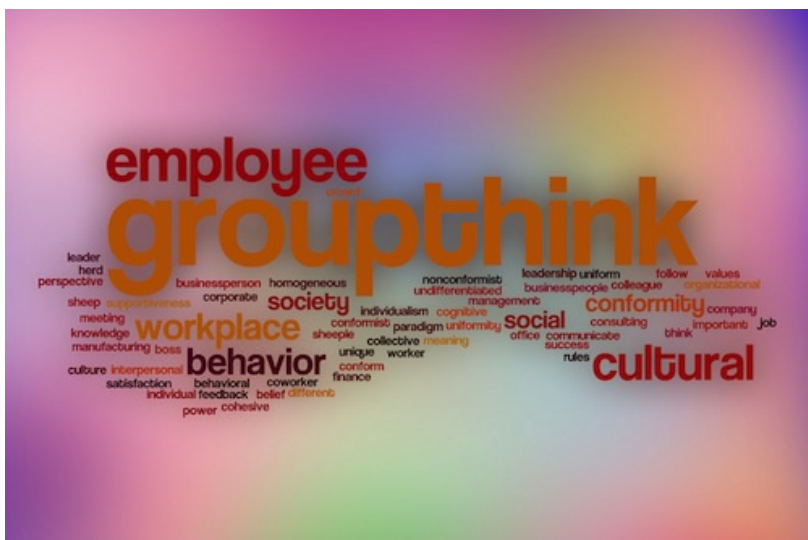
Dr. Judith Curry verfiel dem Gruppendenken über das Thema menschengemachte Klimaerwärmung

Dr. Judith Curry ist Professorin und frühere Vorsitzende der School of Earth and Atmospheric Sciences (Schule für Erd- und atmosphärische Wissenschaften) am Georgia Institut für Technologie. Sie unterstützte die AGW-Agenda, doch nach dem ClimateGate E-Mail-Skandal im November 2009 änderte sie ihre Meinung. Sie