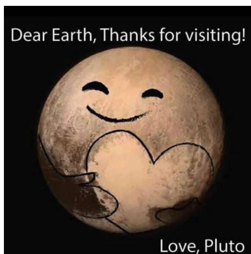
Pluto hat ein Herz!

Neptun: 40%-Zunahme der Helligkeit der Atmosphäre