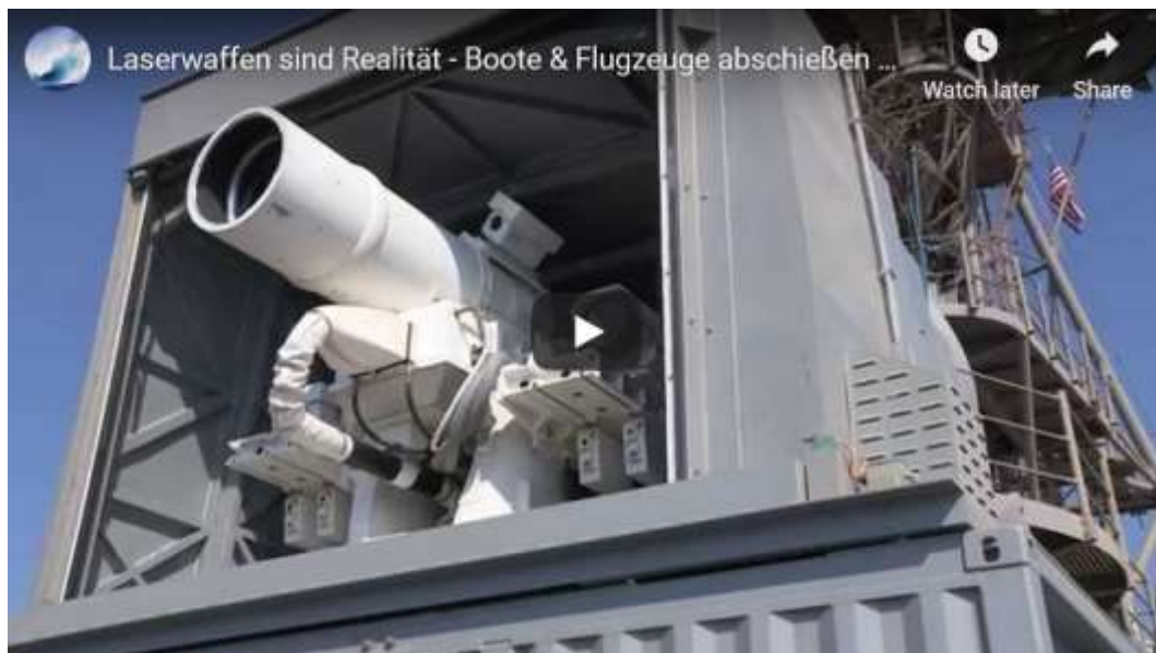
Video zeigt Energiewaffen in Aktion!

Im folgenden Video wird demonstriert, wie das Waffensystem funktioniert: