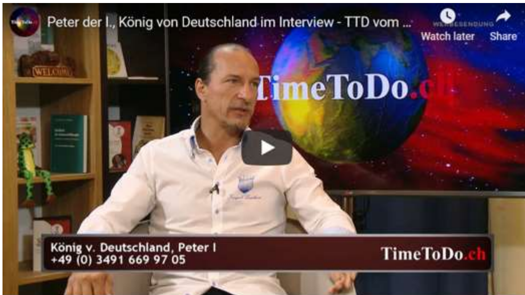
Interview mit Peter Fitzek

https://www.youtube.com/watch?v=LqE87A1YqFU