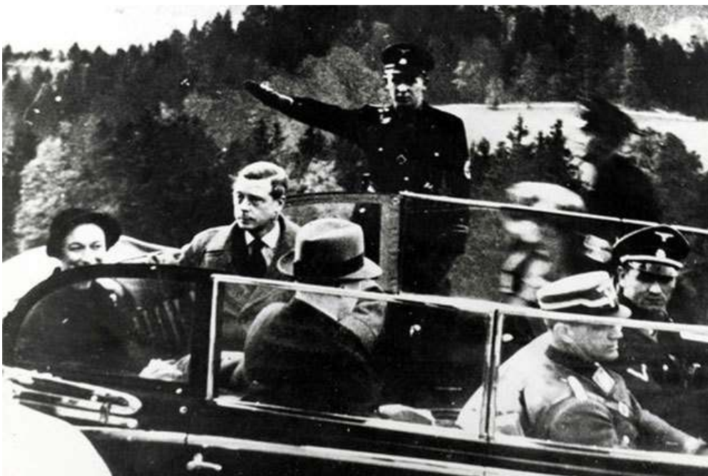
(Der ehemalige König und seine Frau tourten 1937 durch Nazi-Deutschland)

Der Herzog und die Herzogin von Windsor wurden stattdessen gezwungen, im Ausland zu leben, und im Jahr 1937 tourten sie durch Nazi-Deutschland, obwohl britische Beamte ihnen stark davon abrieten, dorthin zu gehen.