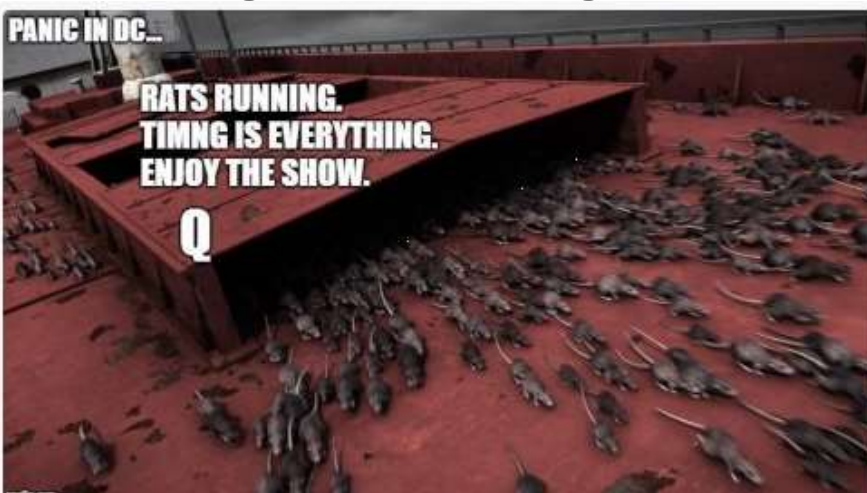
„Die Ratten rennen. Timing ist alles. Genießt die Show!“

die volle, unredigierte Veröffentlichung der FISA-Dokumente!