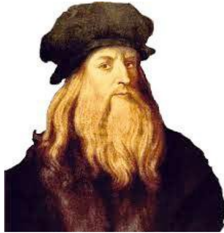
Leonardo Da Vinci

Die Aussage des am 15 April 1452 in Anchiano Italien geborenen und am 2 Mai 1519 in Frankreich verstorbenen Universal-Genies der ersten Renaissance der schönen Künste Leonardo Da Vinci: "Die Liebe siegt immer", bewahrheitet sich nun in der Endzeit, in der Renaissance der Liebe!