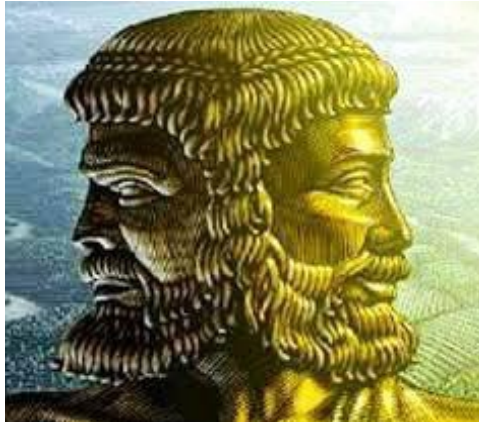
Der römische Gott Janus

Ich hatte das Janusprinzip des zweiköpfigen römischen Gottes bereits vorgestellt.