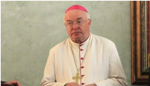
Erzbischof Józef Wesolowski

Der Vatikan ließ verlautbaren, dass das Zurückrufen des Priesters mit den diplomatischen Praktiken souveräner Staaten vereinbar sei. Bereits im Jahr 2013 wurde ein Botschafter des Vatikans, Erzbischof Józef Wesolowski, aus der Dominikanischen Republik zurückgerufen, weil er beschuldigt wurde, minderjährige Jungen sexuell missbraucht zu haben. Wesolowski wurde deswegen offiziell angeklagt.