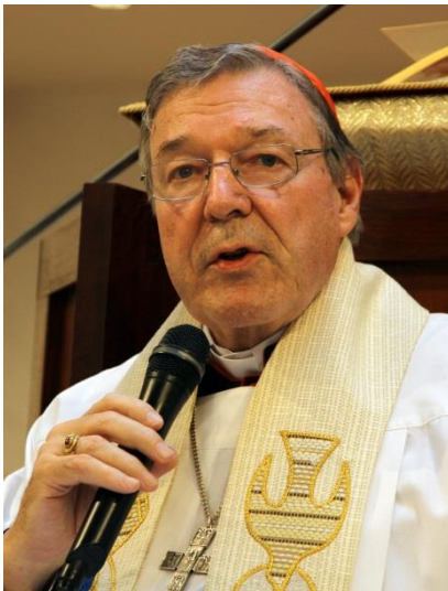
Kardinal George Pell

Am 15. September 2017 kam es dann zum nächsten Skandal .