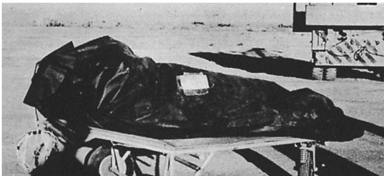
(Im Bild eines Fotos aus dem “Roswell Report” der Air Force vom 24. Juni 1997, in dem der UFO-Vorfall in Roswell besprochen wird)

Aber am nächsten Tag widerriefen sie die Aussage und sagten, die Scheibe sei nur ein beschädigter Luftballon der US Air Force.