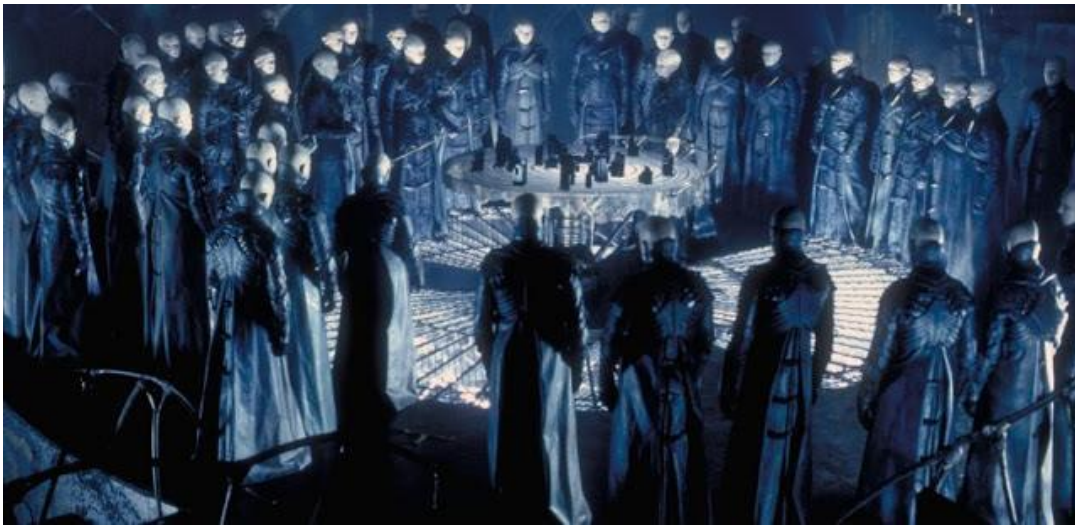
Die vom Team Dunkel

genutzte Überlagerung besteht aus vielen Programmierungs-Techniken, die auf vielen anderen Planeten getestet und verfeinert wurden, bevor sie die Erde fanden.