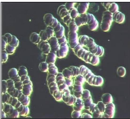
Clumped blood cells

Studien, die am Max-Planck-Institut durchgeführt wurden zeigten, dass die Skalarenergie, wenn sie auf lebende Zellen angewendet wurde, das Entklumpen von Zellen förderte. Bei Krankheiten oder Verletzungen gibt es eine Schwellung oder eine Stauung im Blut und in der Lymphzirkulation. Rote und weiße Blutzellen neigen dazu, zusammen zu klumpen. Wenn Skalarenergie auf den menschlichen Körper angewendet wird, verbessert die Skalarwelle das Bio-Feld, das vom Körper ausstrahlt, und arbeitet gleichzeitig auch intern, indem es in das Körpergewebe eindringt. Der expansive Effekt bewirkt eine Entspannung und Erweiterung der peripheren Blutgefäße im menschlichen Körper. Dies zusammen mit dem Entklumpen der Zellen erhöht die Gesamtzirkulation.