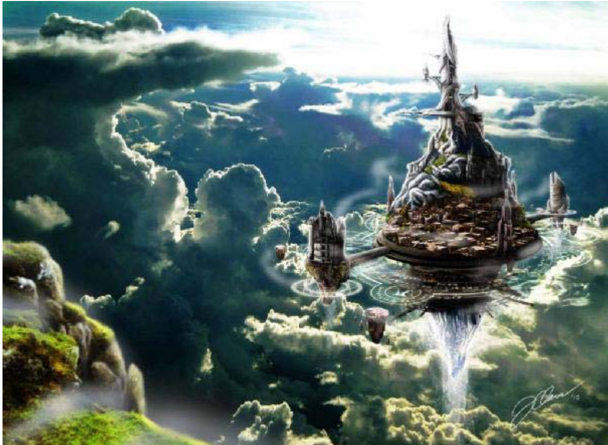
SkyCastle by Canzone at deviantART

Übersetzer-Team: Benario, Chaglia, Herzlein, Maarde, Silverwings, Solveig, Torsten , Yvonne