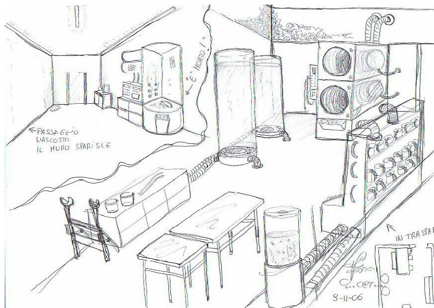
Level 4: Versuche, die Licht-Punkte-Matrix (SEELENBEWUSSTSEIN) der Entführten zu bewegen und sie in einen fremden Körper zu zwingen. Link to article by Eve Lorgen: http://tinyurl.com/qh78w4z

Sie haben keine Geschlechtsorgane und wissen nicht, wie man Kinder bekommt... Sie machen alles im „Reagenzglas“ und hoffen, die Seelenfamilie kommt. Viele ihrer Seelenfamilien hängen hier fest und können nicht eingeladen werden, weil die Regeln der Seelenfamilie so spezifisch sind. Nun, diese Gesellschaften sind verzweifelt. Es sind nur noch ein paar Tausend ihrer Spezies übrig. Also werden sie das unterirdische Schmuggelnetzwerk nutzen – was die (15) multidimensionalen Wesen sind – um Menschen aus dieser Welt zu entführen und ihre DNS zu ernten, deren Seelencodes zu bekommen, um ihre Spezies zu retten. Kann ich ihnen das vorwerfen? Nein. Sie