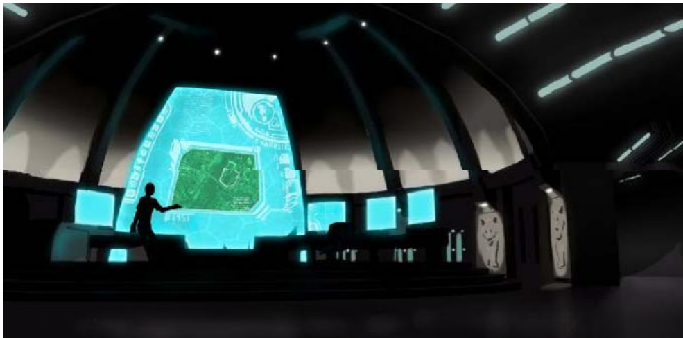
Kontrollraum (Control Room)

AB: Wir sind so viele Male durch die Zeit zurück zum Anfang gereist, dass die Erde viele erste Rassen haben muss. Es sind Lichtwesen und die Grau-Wesen, die sagen: „Wir werden die Traumzeit-Verteidiger der Erde in der Zukunft sein, und wir werden tief in das Herzstück der Erde gehen und Seelenraum-Gesellschaften bilden“, damit der Austausch von Bildung, Verstehen und Lehren unter Seelen auf dieser Welt weitergehen kann, auch wenn sie nicht auf der Abschluss-Zeitlinie sind. Sie sind immer noch in der Lage, mit ihrer Seelenfamilie zu wirken. Nun, die 72 ersten Spezies der Erde repräsentieren die Zeitreisen-Kriege. Das agarthische Netzwerk ist separat von den Zeitreisen-Kriegen. Es wurde so geschaffen, um außerhalb der Zeitkriege, in einem eingeschränkten Konzept, zu sein. Als Atlantis seinen zukünftigen Abstieg realisierte, war es der letzte Schritt seines Verschanzungs-Prozesses – der letzte Pyramiden-Prozess – sie errichteten Kontrollräume auf der Erde und von diesen Kontrollräumen gibt es 40 überall verteilt. Einundzwanzig (21) davon sind momentan unter der Kontrolle von beiden, Licht- und Dunkelkräften, aber du brauchst alle 40 Kontrollräume, um die Schwingung dieses Planeten anzuheben. Das agarthische Netzwerk überwacht die anderen 19, die versteckt sind .